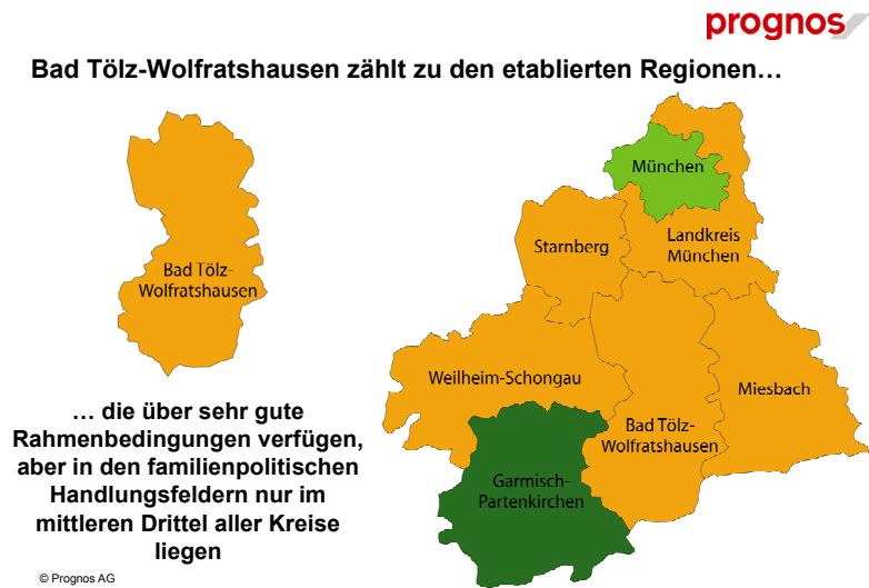
Abbildung 2: Ausschnitt Familienatlas 2007: Region Bad Tölz-Wolfratshausen

(wie sie für eine Großstadt typisch ist) der Gruppe der aufstrebenden Regionen zugeordnet.